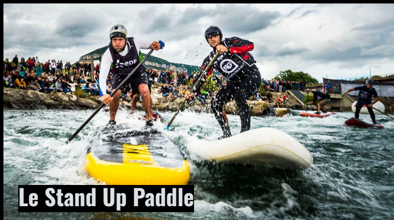
Le Stand Up Paddle