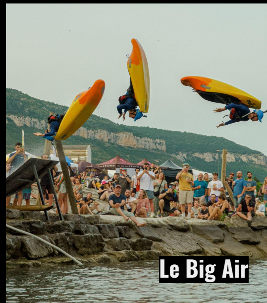
Le Big Air