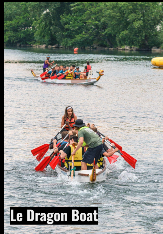
Le Dragon Boat